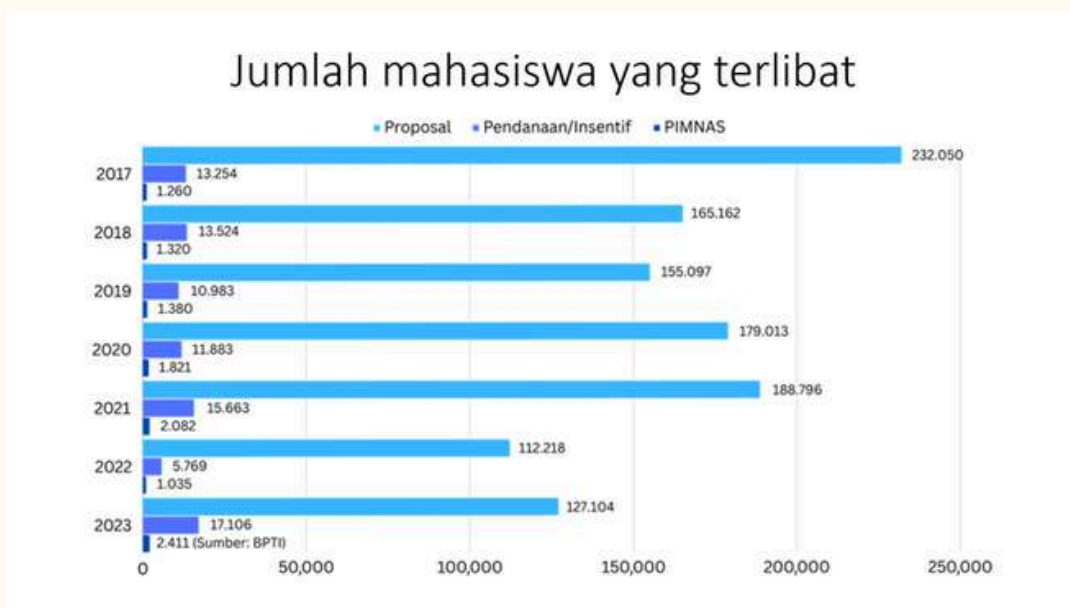
Gambar 2. Perkembangan jumlah mahasiswa yang terlibat PKM periode 2017-2023